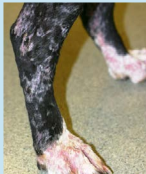
Figura 4c. Primer plano de escamas en las patas traseras del perro de la Fig. 4a.