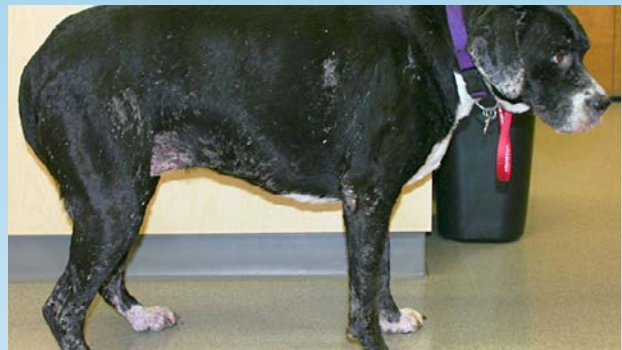
Figura 4a. Lesiones del LCCT en un bóxer.