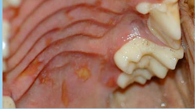
Figura 2. Lesiones del LCCT en el paladar duro.