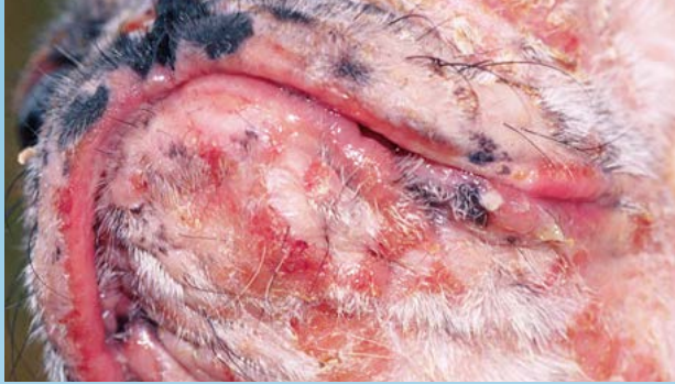
Figura 1. LCCT en el mentón y el hocico.