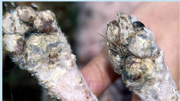
Figura 5. Lesiones del LCCT que provocan la formación de costras y descamación en las almohadillas, lo que genera pioderma secundario.