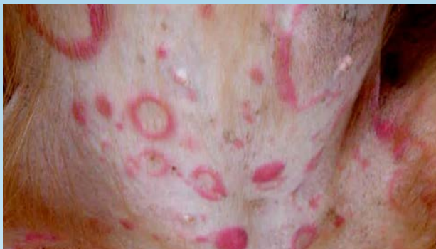
Figura 3. Lesiones del LCCT en el abdomen ventral.