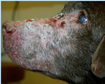
Figura 11. Paciente canino con alopecia, eritema y costras debido a la infección por T. mentagrophytes .