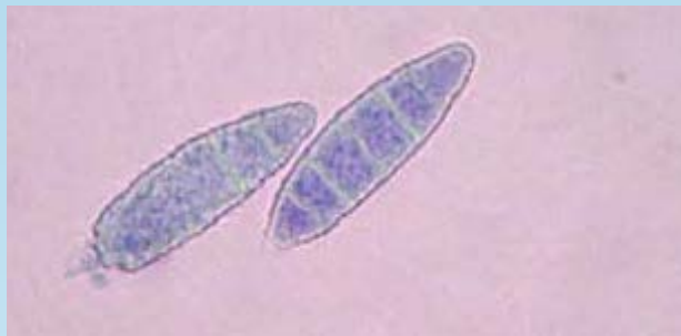
Figura 5. Macroconidia de M. gypseum de un cultivo positivo. Notar que cada espora tiene 6 divisiones o menos divisiones.