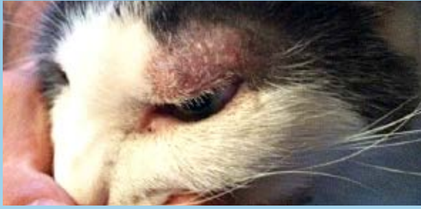
Figura 7. Paciente felino con alopecia multifocal, eritema y escamas debido a una infección por M. canis .