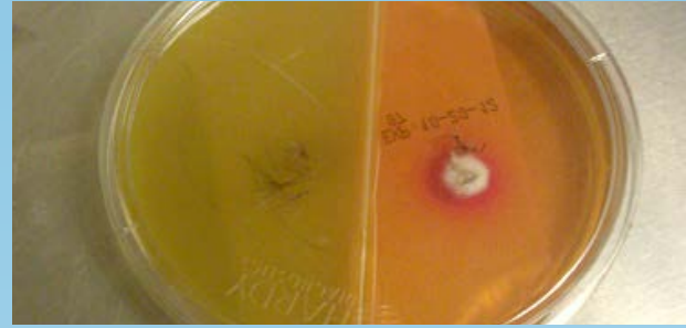
Figura 2. El cultivo positivo muestra cambio de color y colonias buff-colored (teñidas de rojo) en la MPD (derecha) luego de 8 días de incubación. El cambio de color ocurrió dentro de las 24 horas durante el crecimiento de la colonia.