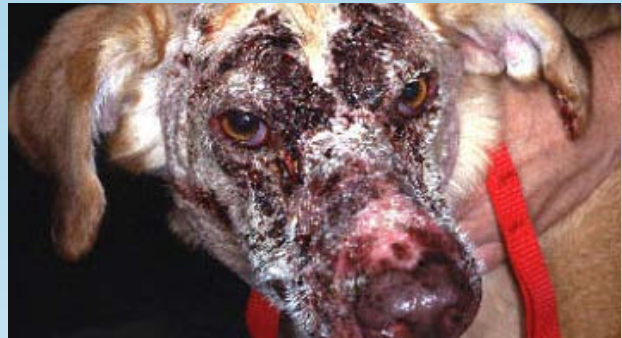
Figura 10. Paciente canino con alopecia, eritema y costras debido a una infección por T. mentagrophytes similar al pénfigo foliáceo.