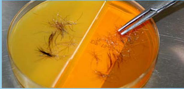
Figura 1. El Medio para Prueba de Dermatofitos (MPD) (derecha) y el agar para esporulación mejorado (izquierda) son inoculados con pelos arrancados y escamas.