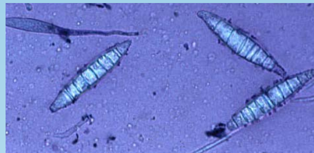
Figura 4. Macroconidia de M. canis de un cultivo positivo. Notar que cada espora tiene más de 6 divisiones.