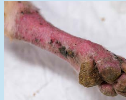
Figura 13. Foto de un paciente canino con una alopecia, eritema y costras en una extremidad debido a una infección por T. mentagrophytes