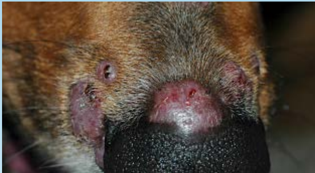
Figura 9. Paciente canino con una lesión de dermatofitosis nodular (“querion”) debido a una infección por T. mentagrophytes .