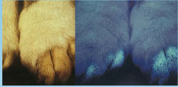
Figura 8. Examen con lámpara de Wood positivo en un paciente felino con alopecia multifocal y escamas debido a M. canis . Notar el cambio de color azul/verde relacionado con la base de los pelos.