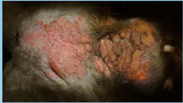
Figura 1b. Primer plano de la placa eosinofílica en la Figura 1a.