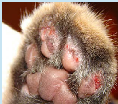
Figura 4. Granulomas eosinofílicos ulcerados en las almohadillas de un gato.