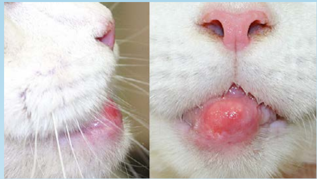
Figura 3. (izquierda) Vista lateral del granuloma eosinofílico en el mentón de un gato; (derecho) Vista frontal del granuloma eosinofílico