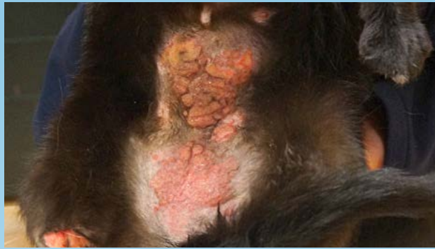
Figura 1a. Placa eosinofílica en el abdomen ventral de un gato.