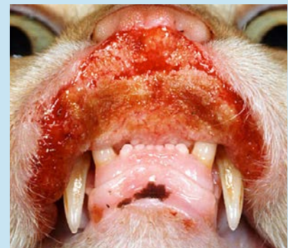
Figura 6. Manifestación grave de una úlcera indolente en un gato.