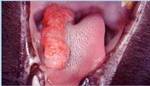
Figura 2. Granuloma eosinofílico en la lengua de un gato.