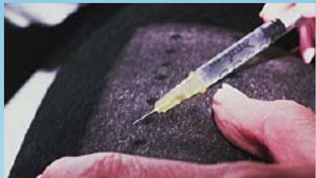
Inyección de alérgeno en la dermis