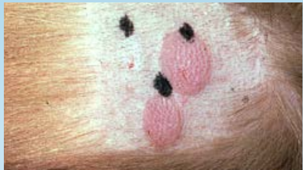
Prueba intradérmica positiva de un alérgeno de la pulga (controles (-) y (+) en la hilera superior)