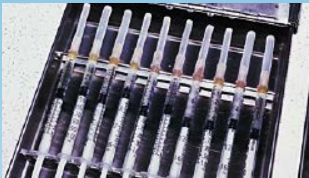
Múltiples jeringas cargadas con alérgenos para una prueba intradérmica