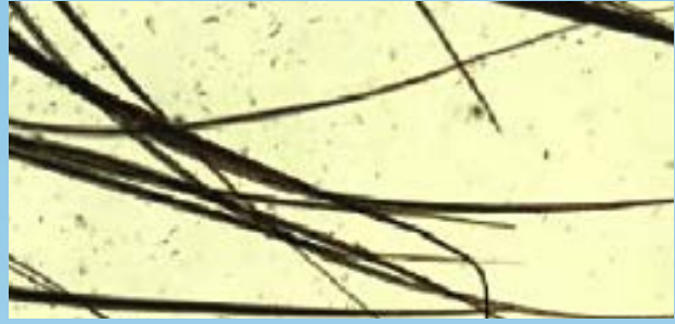
Tricograma con puntas de pelo puntiagudas