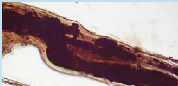
Alopecia por dilución de color alopecia - macromelanomas