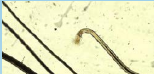
Bulbos de pelo en fase anágena