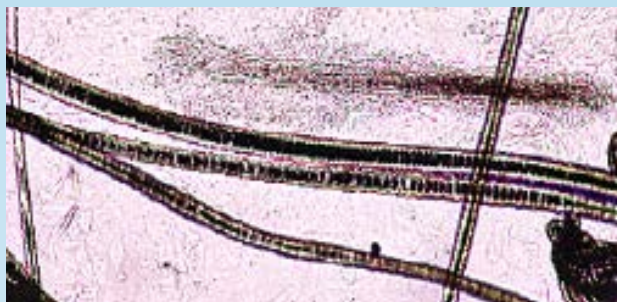
Esporas de dermatofitos en el aire