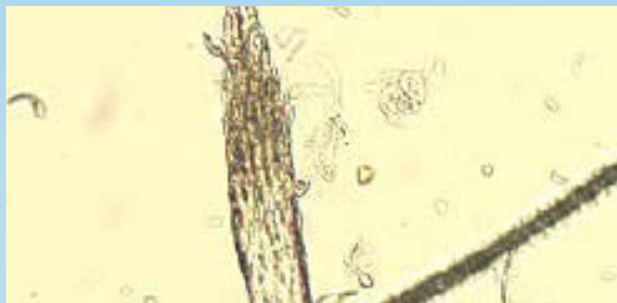
Bulbos de pelo en fase telógena