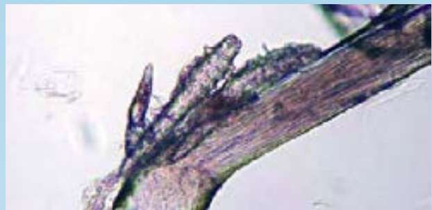
Demodex canis : dos ácaros adultos y una larva en un bulbo de pelo