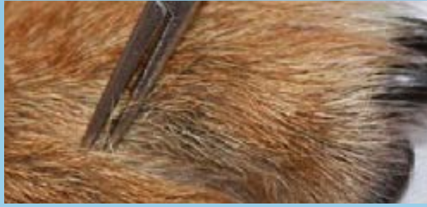
Muestras de pelos para un tricograma